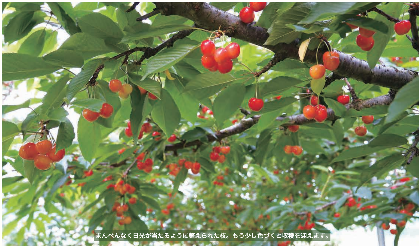
まんべんなく日光が当たるように整えられた枝。もう少し色づくとも収穫を迎えます。