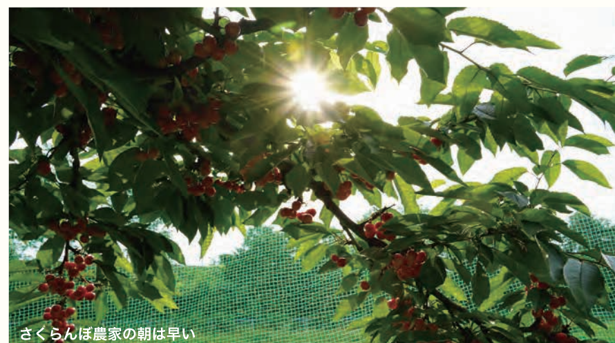
さくらんぼ農家の朝は早い

さくらんぼは温度変化に非常に弱い果物です。届きましたらすぐに冷蔵庫に入れていただき、できるだけその日のうちにお召し上がりください。 ほんのわずかな期間にしか体験できない本場の感動を今年もお届けできることを私たちも楽しみにしています!