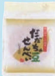
・ 6枚 だだちゃ豆しょう油