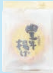
・ 5枚 豊年揚げ