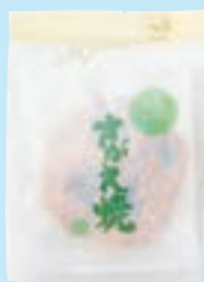
・ 7枚 さがえ焼

「今日はどれから開ける？」 夏のひとときをより楽しくお過ごしいただける 限定品やおすすめ品を選びすぎりました！ しかも今だけ、選べるおまけ付き！ ご注文時に下の5つの中から1つお選びください。