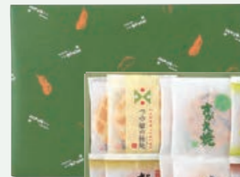
化粧箱大 だだちゃ豆詰合せ