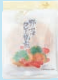
・ 5枚 野菜カレー揚げ煎