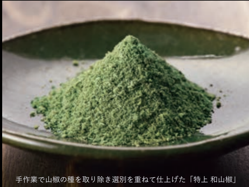
手作業で山椒の種を取り除き選別を重ねて仕上げた「特上 和山椒」

「特上 和山椒」を強めに溶いた 特製しょうゆだれをさらにしみ 込ませるひと手間が肝。 和山椒を振りかけただけでは叶 わない、独特のシビレと鮮烈な 香りがくせになる！