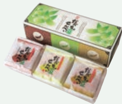
化粧箱小 だだちゃ豆詰合せ