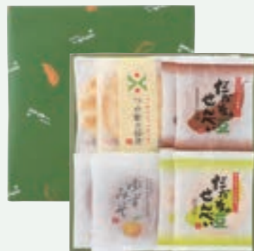
化粧箱中 だだちゃ豆詰合せ