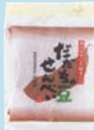
・ 6枚 だだちゃ豆みそ