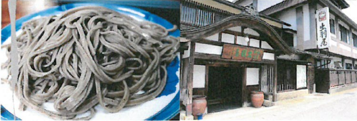
「山菜料理 出羽屋」さん 電話0237-74-2323 〒990-0703 山形県西川町間沢58

というほどお椀に取ります。熱々の汁に冷たいそばを浸し一気にすするとそばの香りと山菜の旨みがロー杯に広がります。うまいー！体も温まる。自家製の七味がまた良い。さて頼んだのはこれだけではない。そば粉を水で溶いた「ハット」も頼んである。沸騰した鍋にハットを入れるとふわふわしたそばの団子が出来上がり。珍しい食感と味わいだ。お腹も満腹になりいつの間にか疲れも吹き飛んでいました。